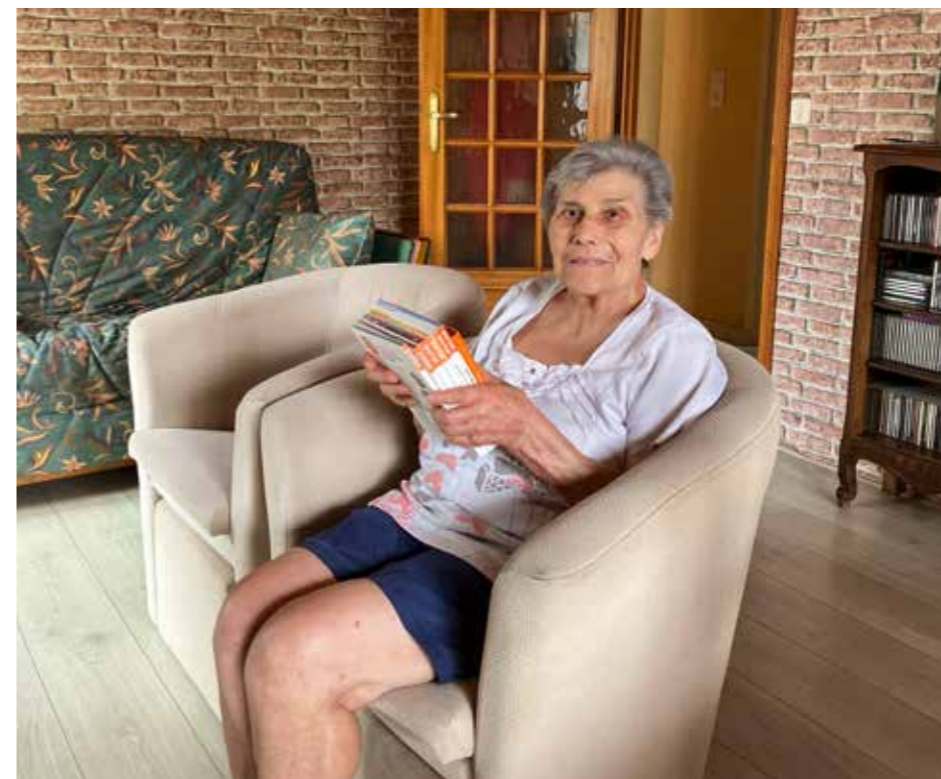
Une habitante bénéficiant du portage de livres à domicile.

Services Ouverte à toutes et à tous, la médiathèque vous accueille gratuitement tout au long de l'année, et peut même venir à vous.