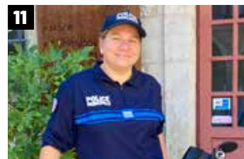
Médiathèque On vous livre !