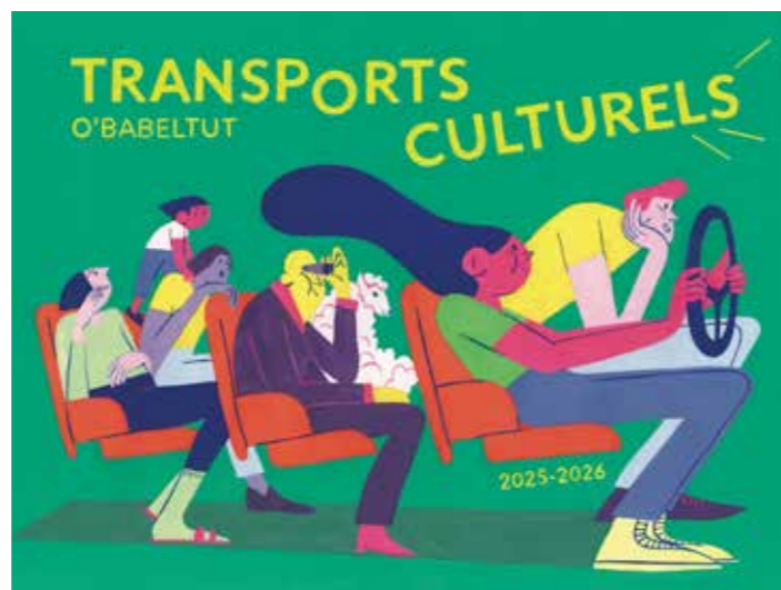
Illustration : Mafjjo

A découvrir sur : www.obabeltut.com / Facebook : obabeltut.babel -06.78.79.13.85 / 06.10.72.38.73 / www.obabeltut.com