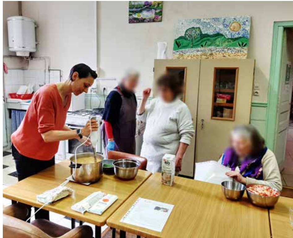
Des ateliers nutrition sont organisés pour les plus de 65 ans.