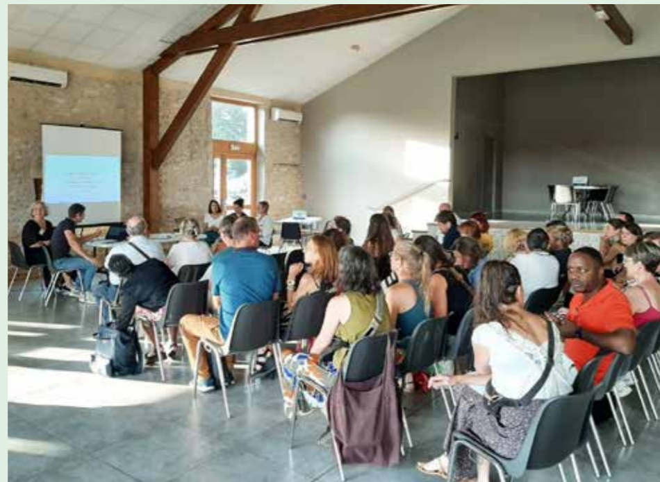
La CPAS rassemble les soignants de 42 communes.

La CPTS développera aussi des parcours de soins pluriprofessionnels, à compter de 2027, en santé mentale pour les collégiens et relatifs